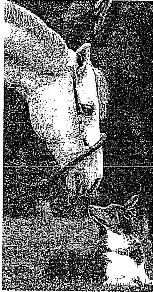
Hund und Pferd beschnupern sich wieder.

Ganz junge Hunde und Pferde-Opas treffen sich in den Hallen. In der Welpenspielstunde sind kleine Kinder und Hunde willkommen, und in der Halle 3B verabschiedet sich ein Show-Urgestein: der 36 Jahre alte Mas-sai, ein Showpferd vom Huf bis zur Mähne, das die Manege eigentlich gar nicht verlas-