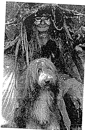
Hund und Frauchen beim Fototermin.

Die Messe ist von Freitag, 15. Oktober, bis Sonntag, 17. Oktober, jeweils in der Zeit von 9 bis 18.30 Uhr geöffnet. Eine Tageskarte für Erwachsene kostet zwölf Euro. Besucher können auch ihre eigenen Hunde mitbringen - allerdings müssen sie dazu einen Impfausweis mit gültiger Tollwutschutzimpfung vorlegen.